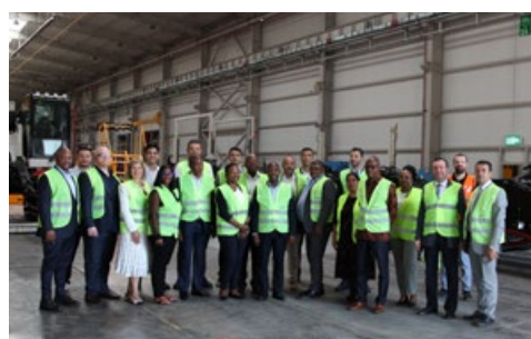
南アフリカ大使と随行団は、HİDROMEK生産拠点を視察した。 委員会: 南アフリカ共和国大使館 国: 南アフリカ 日付: 2025年8月5日