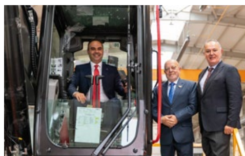
トルコ共和国産業技術大臣メフメト・ファティフ・カチル氏、シリア経済産業大臣ニダル・アッ＝シャーアール氏及び随行団が、新設されたHİDROMEK生産拠点を視察し、当社のエクスカベーター生産ラインの開所式に出席しました。 委員会: トルコ共和国産業技術省 & シリア経済産業省 国: トルコ & シリア 日付: 2025年8月5日