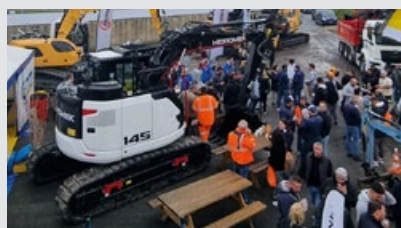
イベント名: ロック&ストーン ディーラー名: Maintenance TP 日付: 2025年9月25日 所在地: パリ / フランス 展示マシン: HMK 145 LC SR