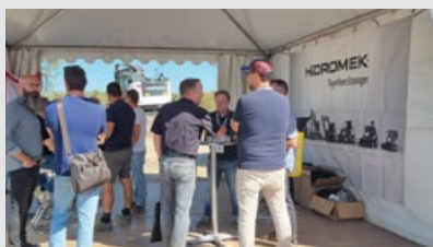
イベント名: DigTour ディーラー名: AM TP 日付: 2025年9月18日～19日 所在地: ボルドー / フランス 展示マシン: HMK 145 LC SR