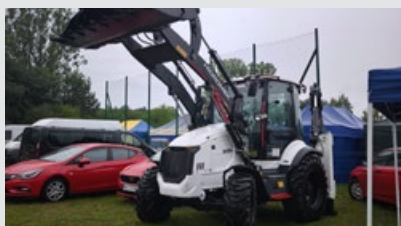
イベント名: アレクサンドロフにおける地区・市収穫祭 ディーラー名: Waryński Trade 日付: 2025年9月14日 所在地: アレクサンドル / ポーランド 展示マシン: HMK 62 T, HMK 102 B Supra