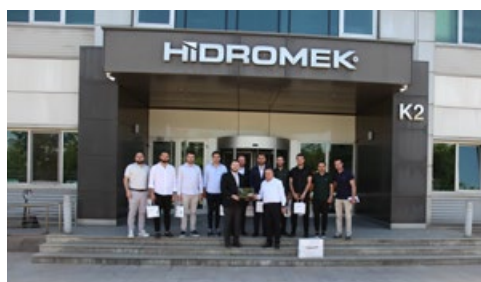
ジェンチ・ムシアド協会の代表団がヒドロメクの生産施設を視察した。 委員会: Genç MÜSİAD協会 国: トルコ 日付: 2025年7月7日