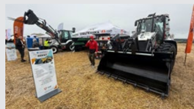
イベント名: アグロ・テルノーピリ ディーラー名: TAD Construction Group 日付: 2025年9月24日～25日 所在地: テルノーピリ / ウクライナ 展示マシン: HMK 102 B Alpha, HMK 102 S Supra